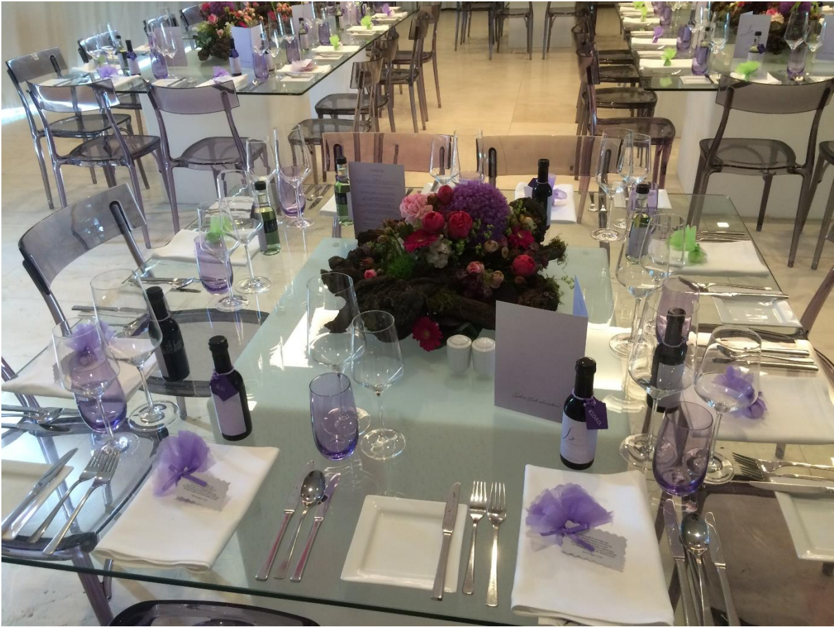
LEO HILLINGER – more than wine!