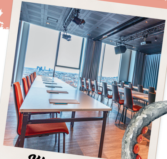
Klassenzimmer max. 32 Personen