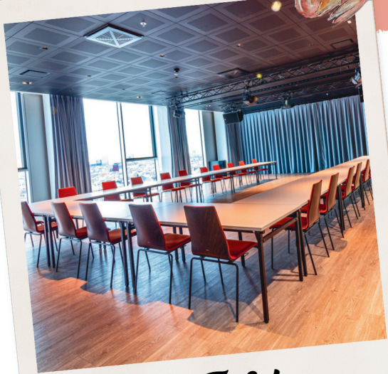
U-Tafel max. 42 Personen