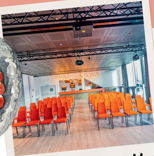
Theater- / Kinobestuhlung max. 120 Personen