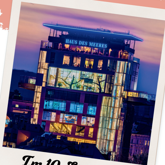
Im 10. Stock des Haus des Meeres