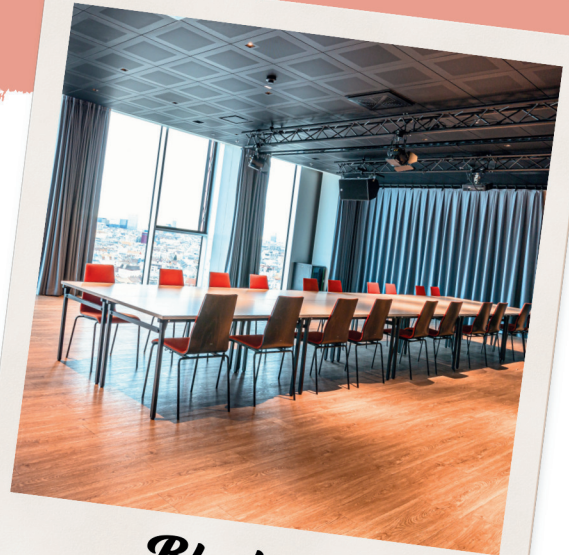
Blocktafel max. 32 Personen