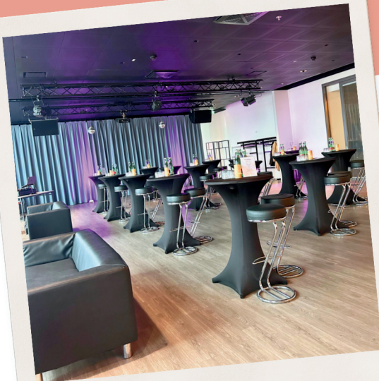
Stehempfang max. 120 Personen