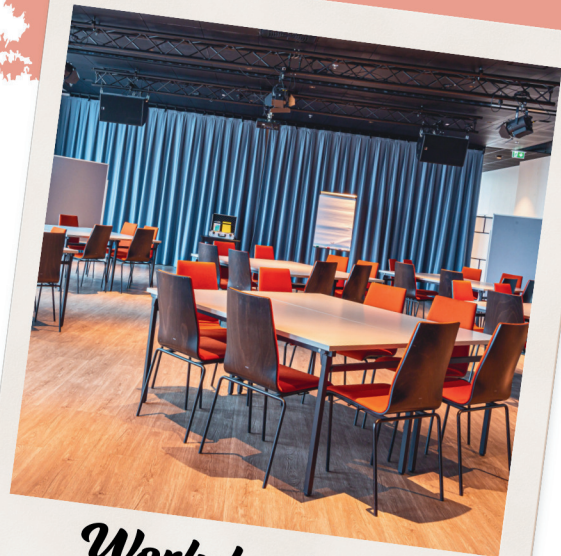
Workshopblöcke max. 64 Personen