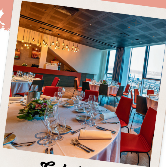
Galadinner max. 80 Personen